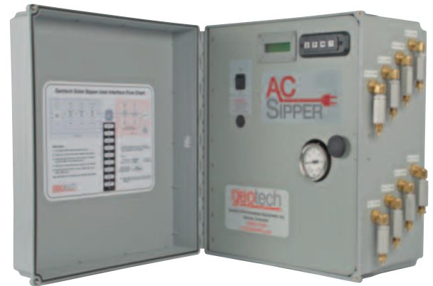
Panel de control y Bomba de Presión/Vacío (Se muestra Control de ocho pozos)