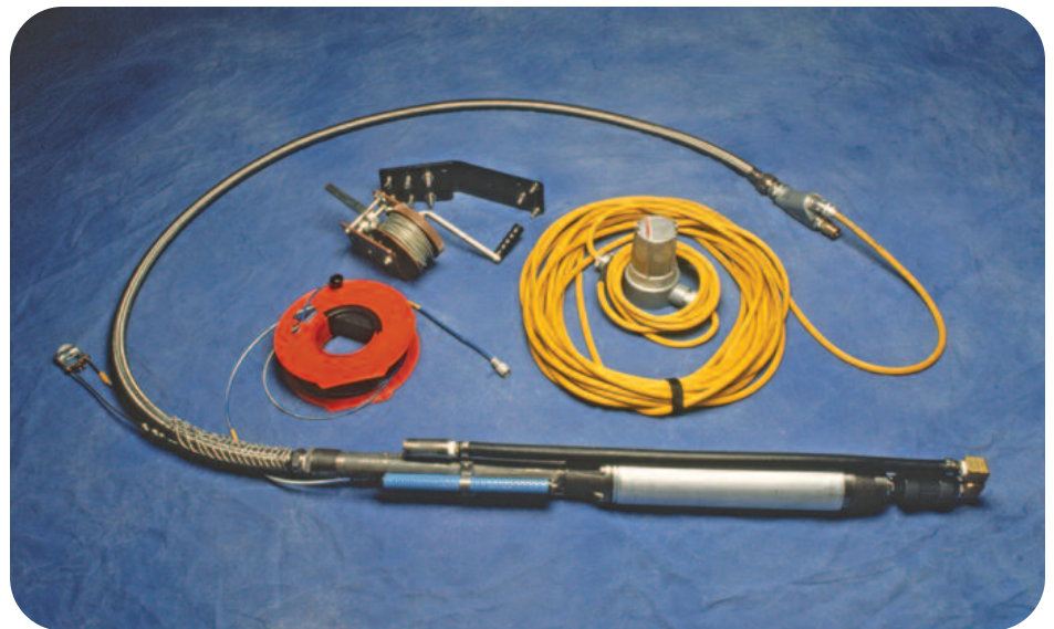
El Sistema Geotech High Volume Probe Scavenger con Cabrestante de Levantamiento Opcional