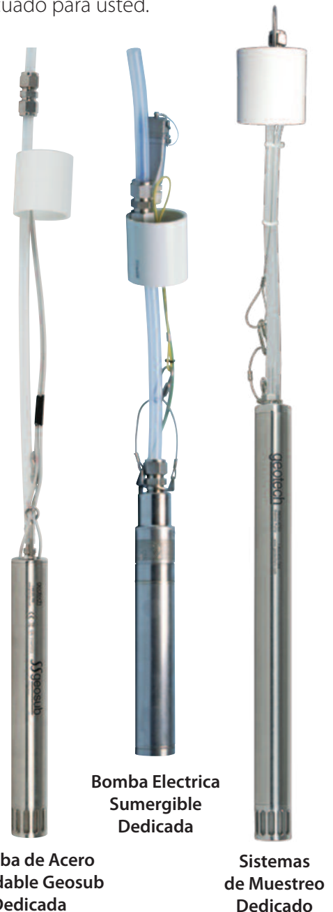
Bomba de Acero Inoxidable Geosub Dedicada